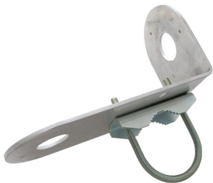
DKH10LTC + UA70

profesionálny držiak pre uchytenie dvoch kamier HIKVISION, DAHUA, TVT a iných značiek na trubku alebo stožiar vo vertikálnej alebo horizontálnej polohe